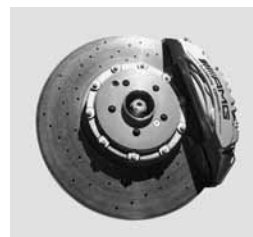
Keramični zavorni sistem AMG (B07)