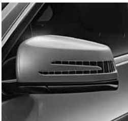
Paket ogledal (249)