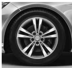
17-/18-palčna platišča (44R/R38)