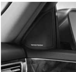
Zvočni sistem Harman Kardon® Logic 7® (810)