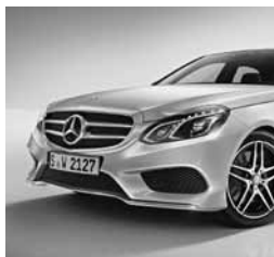
AMG Styling (772)