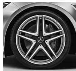
19-palčna kovana platišča AMG (785)