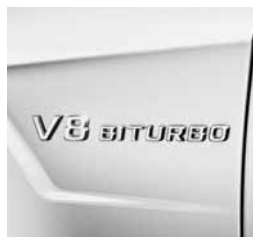
Napis V8 BITURBO