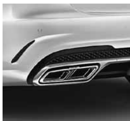
Športna izpušna naprava AMG za model S