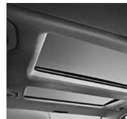
designo strop (Y44)