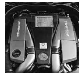
Obloga motorja iz karbona (B14)