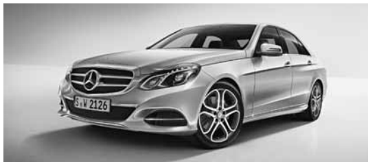
Maska hladilnika z dvema lamelama in zvezdo na sredini (P96)