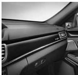
designo ukrasni elementi (W69)