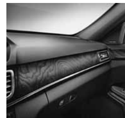
Okrasni elementi jesenovina (H09)