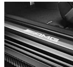
Belo osvetljene vstopne letve AMG (U25)