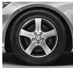
17" platišča (02R)