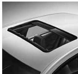
Električno pomično strešno okno (414)