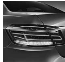
Zadnja luč LED