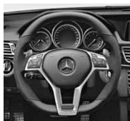
Volan AMG Performance z vstavki mikrokanaline DINAMICA (281)