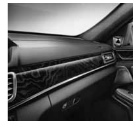
Okrasni elementi - sijoča črna jesenovina (736)