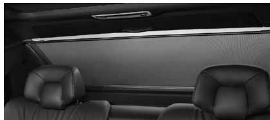
Električni rolo za zadnje okno (P08/540)