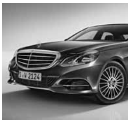
Maska hladilnika s tremi srebrno lakiranimi lamelami