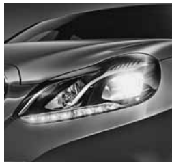
Žarometi delno LED (632)