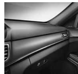
Strukturno brušen temni aluminij (H76)