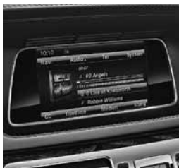
Audio 20 CD (523)