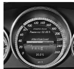
ATTENTION ASSIST (538)