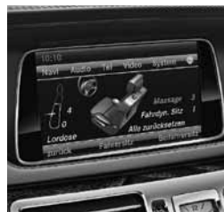
Paket aktivnih sedežev (432)