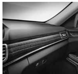
Okrasni elementi evkaliptov les (734)