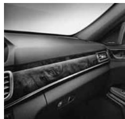
Okrasni elementi - svetlo rjava orehovina (H14)