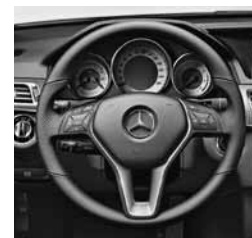
Volan 3-kraki dizajn