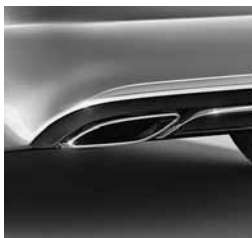
Dvocevna izpušna naprava