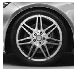
19" platišča AMG (770)