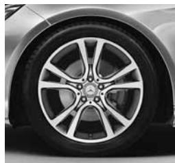
19" platišča (R17)