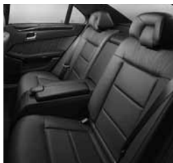
Komfortna posamezna sedeža zadaj (P08)