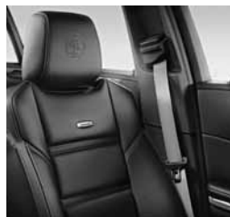
Varnostni pas AMG v srebrni barvi (Y04)