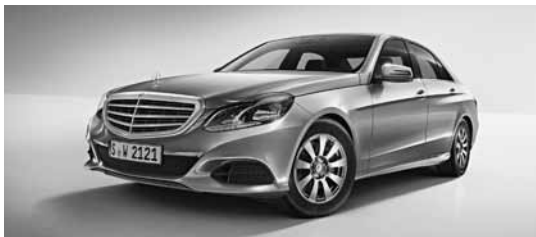
Serijska oprema (953)