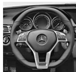
Volan AMG Performance