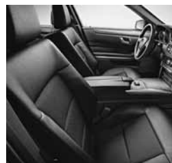
Imitacija usnja ARTICO/črna tkanina Grenoble (411)