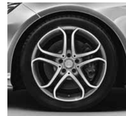
18-palčna platišča (22R/66R)