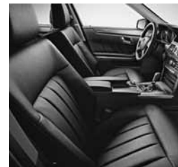
Črno usnje (211)