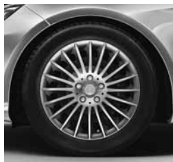
16-/17-palčna platišča (43R/08R)