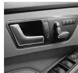
Paket Memory (275)