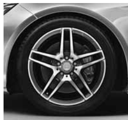
18-palčna platišča (660/794)