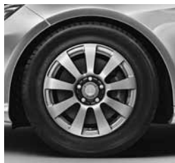
16" platišča (R13)