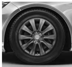
16" platišča (55R)