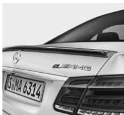
Paket karbona za zunanost 2 (B28)