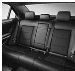
Imitacija usnja ARTICO/črna tkanina Grenoble (411)