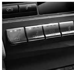
Klimatizacija sedežev (401)