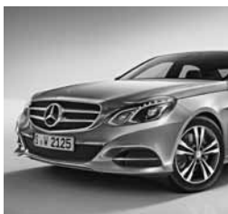
Maska hladilnika z dvema lamelama in zvezdo na sredini