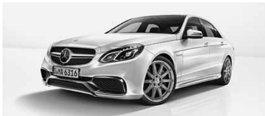
E 63 AMG S 4MATIC