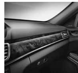
Temno rjava sijoča orehovina (H14)