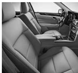
Sivo blago Straßburg (018)