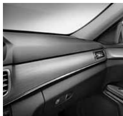
Okrasni elementi v aluminiju (H76)