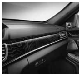
Armaturna plošča v imitaciji usnja ARTICO (P34/U09)