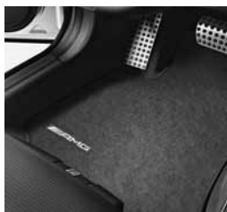
Predpražniki AMG (U26)