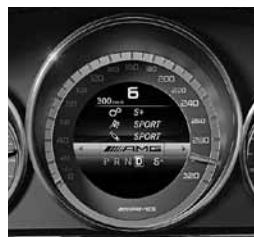
AMG Drivers paket, kombinirani inštrument (250)