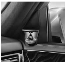
Bang & Olufsen BeoSound AMG (811)