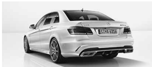
E 63 AMG S 4MATIC