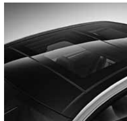
Panoramsko pomično strešno okno (413)