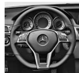
Športni volan AMG, spodaj sploščen (277)