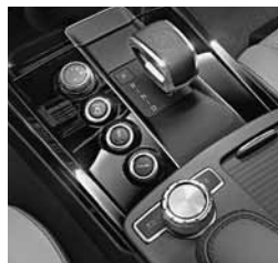
AMG DRIVE UNIT