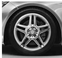
18" platišča AMG (791/795)