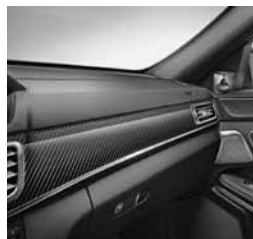
Okrasni element karbon/črni klavirski lak (H73)