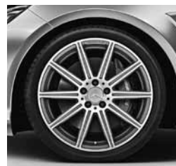
19-palčna platišča AMG (797)