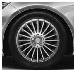
43,2/45,7 cm (17"/18") platišča iz lahke kovine (08R/04R)