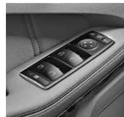
Električni pomik stekel