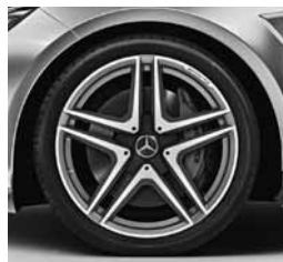
19-palčna platišča AMG (797)