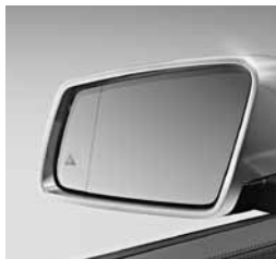
Paket za ohranjanje smeri (234)