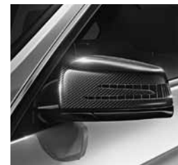
Paket karbona za zunanost 2 (B28)