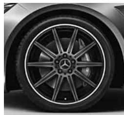
19-palčna platišča AMG (752)