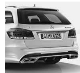
E-T 63 AMG S 4MATIC