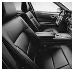
Športni sedeži v usnju (244)