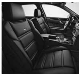
Športni sedeži AMG