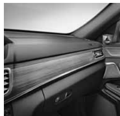
designo ukrasni elementi (W26)