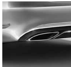
Dvocevna izpušna naprava