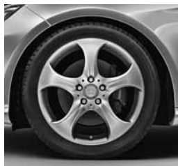
18" platišča (R08/52R)