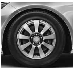
40,6 cm (16") platišča iz lahke kovine (R12/R13)