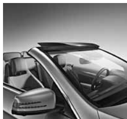
Ogrevano zunanje ogledalo