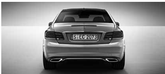
Športni paket za zunanost

Dvocevna izpušna naprava z oglatimi okvirji