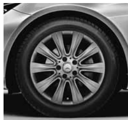
43,2 cm (17") platišča (25R)