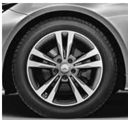
43,2 cm (17") platišča iz lahke kovine (44R)