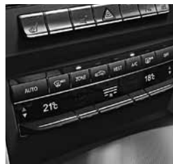
Klimatizacija THERMOTRONIC (581)