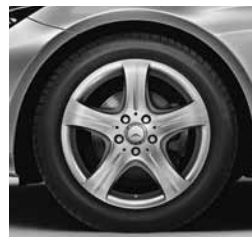
43,2 cm (17") platišča (R22)