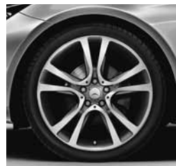
48,3 cm (19") platišča (R17)