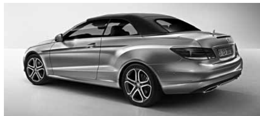
Športni paket za zunanost