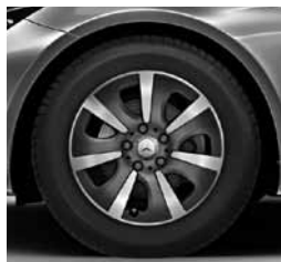
40,6 cm (16") platišča (34R - samo za kupe)