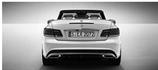
Športni paket AMG