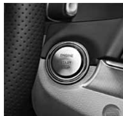
KEYLESS GO (889)