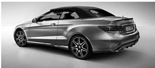
Športni paket AMG Plus