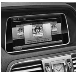
COMAND Online (527/512)