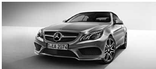
Športni paket AMG Plus