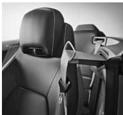
Podajalnik varnostnega pasu