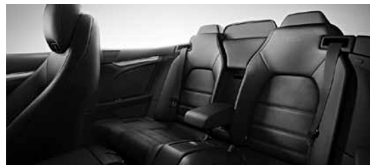
Posamezni sedeži zadaj