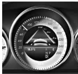
COLLISION PREVENTION ASSIST