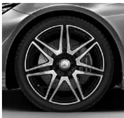
48,3 cm (19") platišča AMG (662)