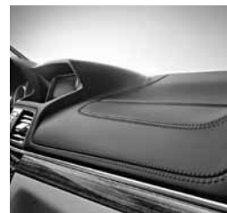
Armaturna plošča v napa usnju (U09)