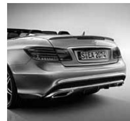
Športni paket AMG Plus