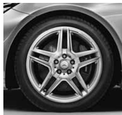
45,7 cm (18") platišča (795)