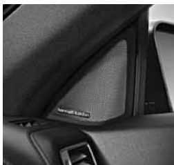
Harmann Kardon® Logic 7® (810)