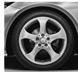
45,7 cm (18") platišča (R08)