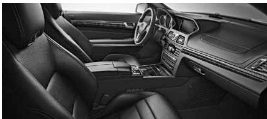
Paket sedežev za nastanitev več položajev