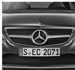
Zvezda integrirana v masko hladilnika