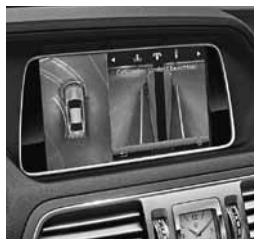
Paket za parkiranje (P44)