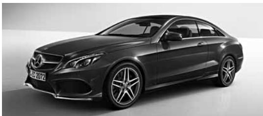
Športni paket AMG