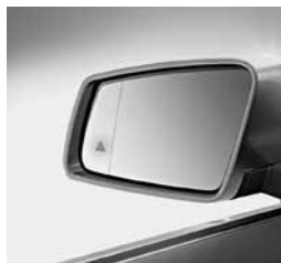
Asistent za mrtvi kot (234)