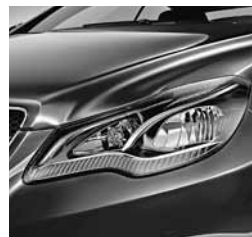
Žarometi delno LED (632)