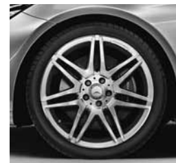
48,3 cm (19") platišča AMG (770)