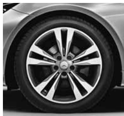
45,7 cm (18") platišča (22R)