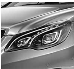
Inteligentni sistem luči LED (642)