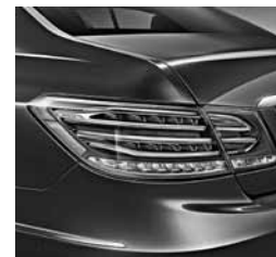
Zadnja luč LED