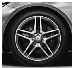
45,7 cm (18") platišča AMG (660)