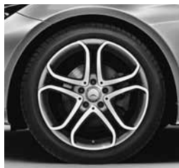
45,7 cm (18") platišča (R71)