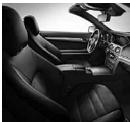
Športni sedeži AMG