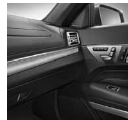
Okrasni elementi v aluminiju