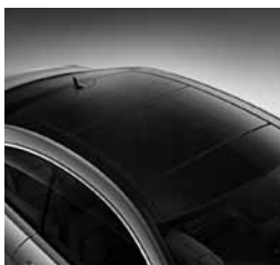
Panoramsko pomično strešno okno (413)