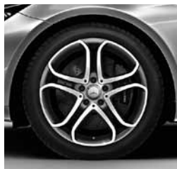
45,7 cm (18") platišča (R71)